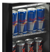
Designet til energidrikke