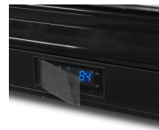
Beskyttende afskærmning af termostat