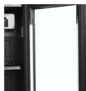
LED-lys i dørramme