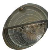
Indvendig ventilator og kurv